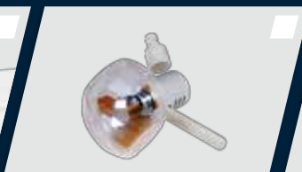
Refletor multifacetado com lâmpada de LED