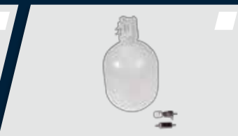
Sistema de assepsia e desinfecção do equipo com válvula antirretração