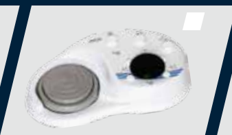
Pedal de comando móvel independente multifuncional