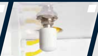
Regulagem externa de água e ar do equipo