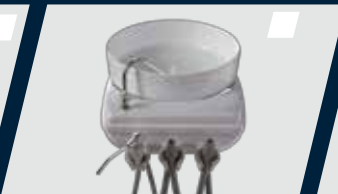
Seringa tríplice incorporada à unidade auxiliar