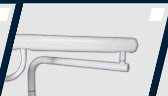
Braço flex com travamento pneumático