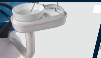
Tubulação totalmente embutida