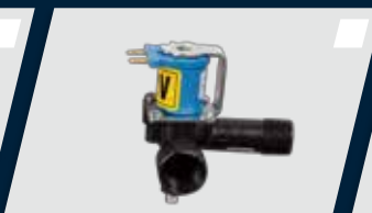
Acionador sensorizado para água da unidade auxiliar com regulador de vazão