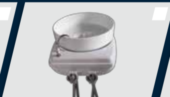
Segundo sugador incorporado à unidade auxiliar