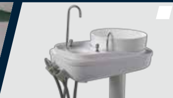
Rebatimento da unidade auxiliar com movimento de 90° a 180°