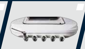
Equipo com 5 pontas