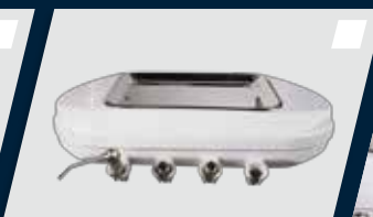
Terminal extra para alta rotação