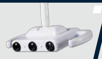
Cabeçote do refletor com iluminação por LED