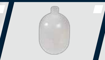
Reservatório de água com capacidade de 1.000 ml (1L)