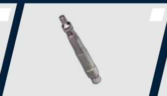
Terminal de baixa rotação com sistema de refrigeração