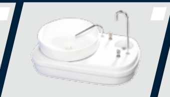
Porta-copo incorporado à unidade auxiliar