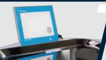
Negatoscópio de LED acoplado