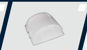
Caixa de comando independente