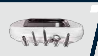
Jato de bicarbonato e ultrassom acoplado